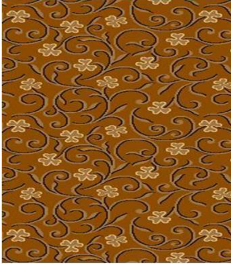
(e) Karpet Tile